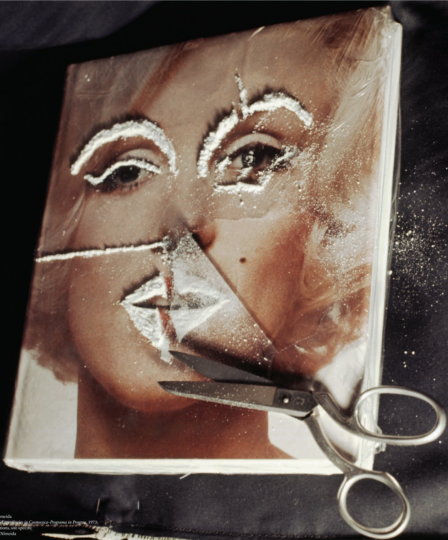
Hélio Oiticica and Neville D'Almeida Slide from CC3 Matterm. Bloco-Experiências in Cosmococa-Programa in Progress , 1973; Slide series, soundtrack, instructions, site-specific © Hélio Oiticica and Neville D'Almeida

PRIVATE PERFORMANCE projection-surface: one slide-set onto a screen/surface of white velvet (real or artificial) or white/thick/shiny vinyl; other slide-set onto wall spreading onto ceiling and/or adjoining wall and/or floor by tilting projector: Improvised at will in a way that is both INVENTIVE and MUSICAL : yes MUSICAL : underfoot: participant placement-transfer occasionally from beams of water to floor-surface (bare or carpeted).