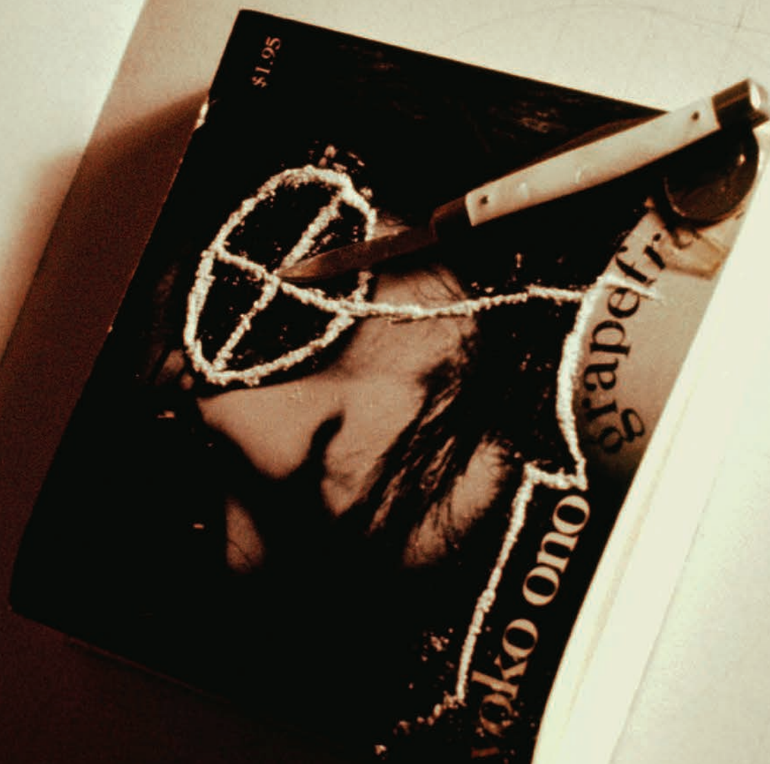
Hélio Oiticica and Neville D'Almeida Slide from CC2 Onobject. Bloco-Experiências in Cosmococa-Programa in Progress , 1973; Slide series, soundtrack, instructions, site-specific © Hélio Oiticica and Neville D'Almeida

Hélio Oiticica and Neville D'Almeida's Private Cosmococas