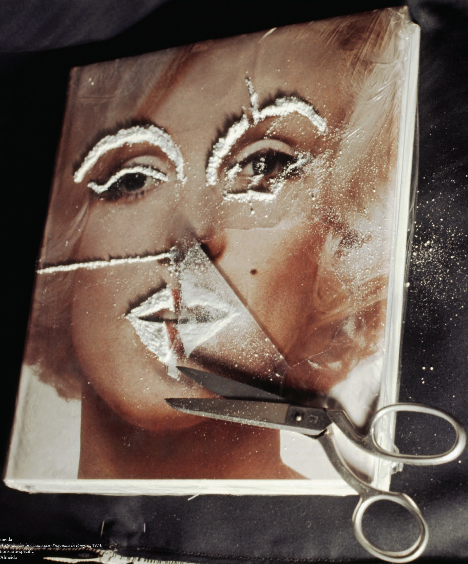
Hélio Oiticica and Neville D'Almeida Slide from CC3 Matterings: Bloco-Experiências in Cosmococa—Programa in Progress , 1973; Slide series, soundtrack, instructions, site-specific © Hélio Oiticica and Neville D'Almeida

PRIVATE PERFORMANCE projection-surface: one slide-set onto a screen/surface of white velvet (real or artificial) or white/thick/shiny vinyl; other slide-set onto wall spreading onto ceiling and/or adjoining wall and/or floor by tilting projector: Improvised at will in a way that is both INVENTIVE and MUSICAL : yes MUSICAL : underfoot: participant placement—transfer occasionally, from beams of water to floor-surface (bare or carpeted).