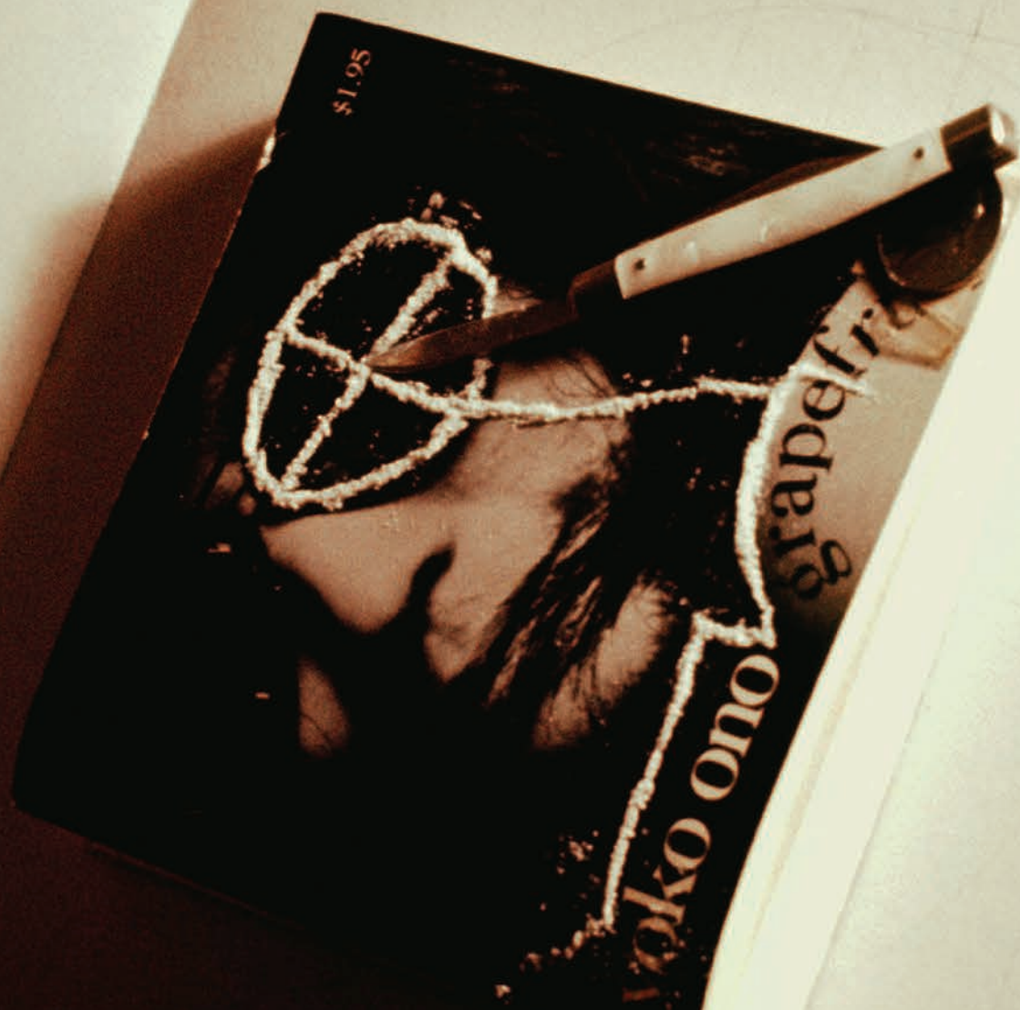
Hélio Oiticica and Neville D'Almeida Slide from CC2 Onobject: Bloco-Experiências in Cosmococa—Programa in Progress , 1973; Slide series, soundtrack, instructions, site-specific © Hélio Oiticica and Neville D'Almeida

Hélio Oiticica and Neville D'Almeida's Private Cosmococas